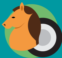
DE CABALLO A RUEDA