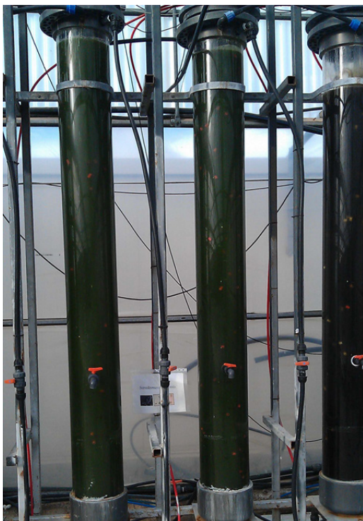
Figura 2. Cultivo de microalgas en columnas de burbujeo en condiciones reales de producción