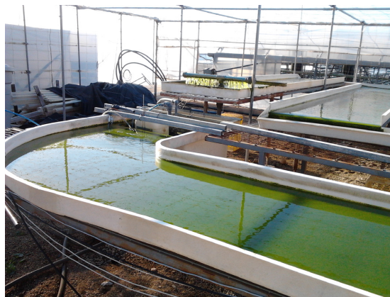
Detalle del fotobio reactor de capa fina.