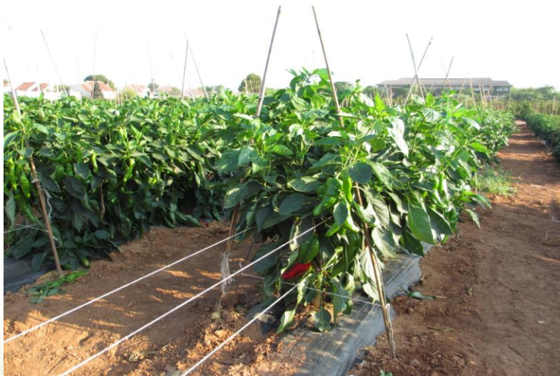
Figura 5.- Encañado.