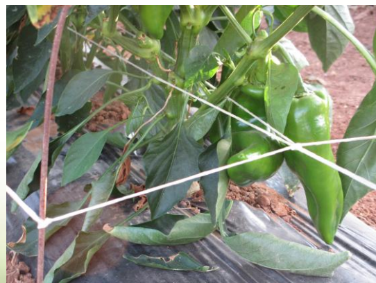
Figura 1. Colocación primer hilo de entutorado a la altura de la cruz