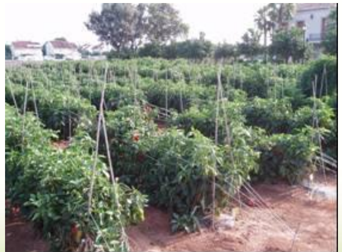
Figura 3.- Colocación cañas cruzadas en V invertida.

Hay agricultores que colocan unas cañas cruzadas o cualquier otro tipo de material que permite añadir más hilos de entutorado y así mantener la planta erecta hasta el final del cultivo, evitando la rotura de ramas como consecuencia del peso de los frutos de las plantas. La colocación de las cañas se hace en forma de V invertida, ya que el peso de los frutos irá abriéndolas progresivamente. Para clavarlas con mayor facilidad es importante dar antes un riego abundante. Una vez puestas las cañas se colocan hilos longitudinales que ataremos a estas, en la medida que el cultivo los vaya necesitando. La distancia aproximada entre dos hilos de entutorado consecutivos para pimiento es de unos 20 cm.