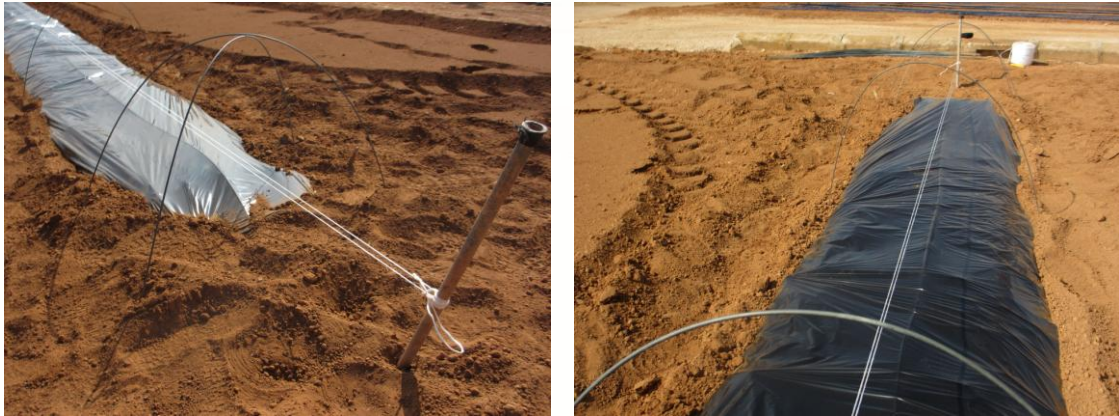
Figura 2. Colocación de dos hilos internos previo a la plantación

En caso de realizar la plantación con disposición de dos filas de plantas por surco dispuestas al tresbolillo, procederemos a la colocación de dos hilos de entutorado interiores previo a la plantación, para en el momento de retirar el sistema de semiforzado colocar por el interior de las varillas dos nuevos hilos para sujetar cada una de las filas de plantas, atándolas a la varilla.