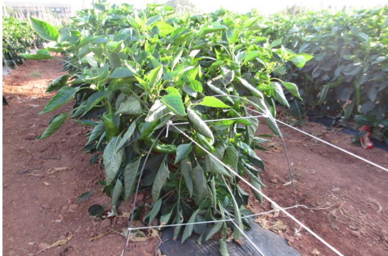
Figura 4. Entutorado a varilla.

Para ello se utilizaron 2 cvs: 'Estrada' e 'Italress'. Se realizó la siembra en semillero profesional el 24 de enero de 2017 y se procedió al trasplante el 24 de marzo. Se utilizó sistema de semiforzado a base de acolchado con polietileno negro y microtúnel, empleando como cubierta, polipropileno no tejido de 17 gr m -2 . El marco de plantación empleado fue de 2 m entre hileras y 0,45 m entre plantas, dispuestas al tresbolillo, con una densidad final de 2,22 plantas m -2 .