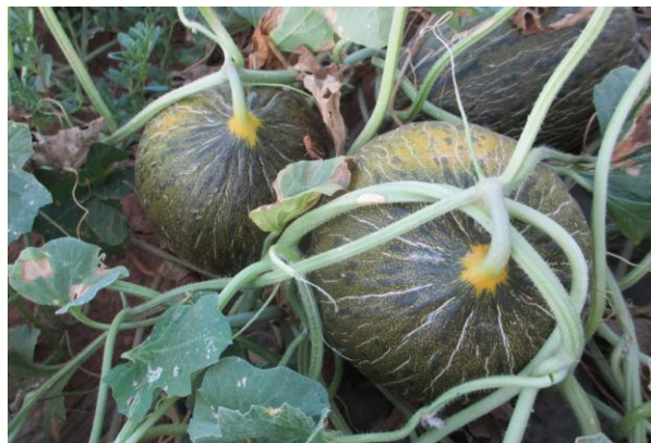
Figura 3.- Amarilleo de la base del pedúnculo.

Con todo, resulta necesario para determinar el momento óptimo de recolección, recurrir a personal especializado y/o proceder a la toma de muestras para determinar el contenido en azúcares (°Brix), mediante refractómetros.