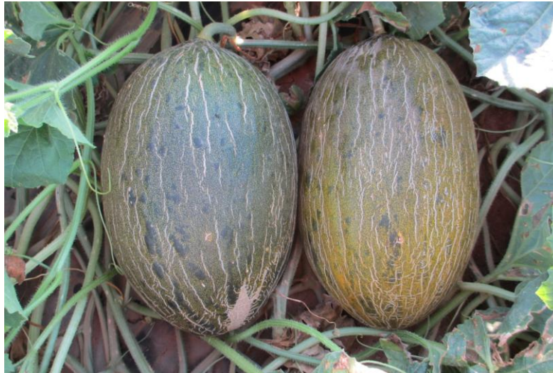
Figura 1. Melones en distinto estado de madurez. A la derecha en su punto óptimo de recolección.