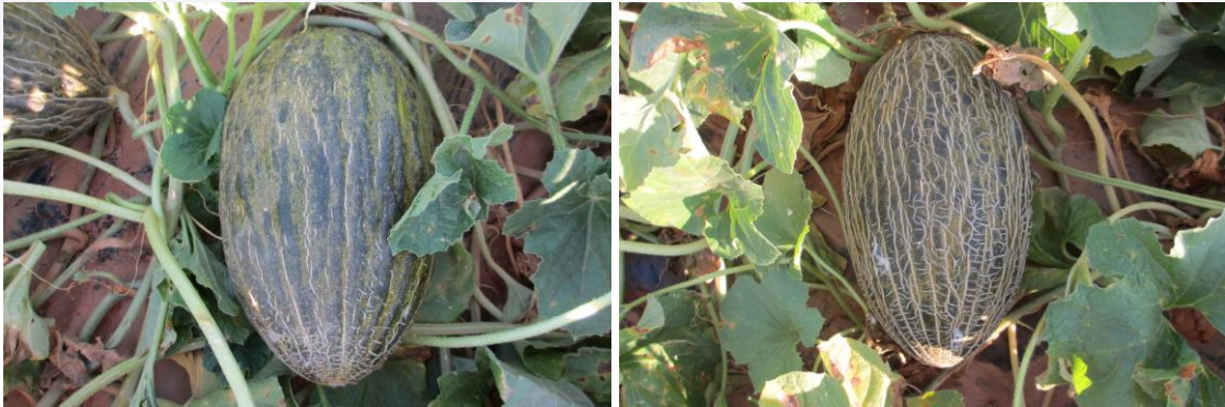
Figura 2.- Aumento significativo del escriturado a medida que madura el fruto.