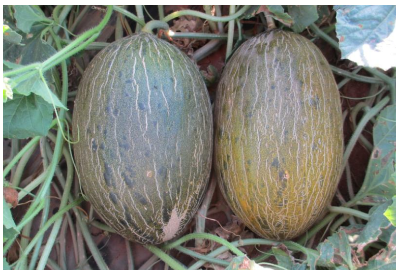
Figura 1. Melones en distinto estado de madurez. A la derecha en su punto óptimo de recolección.