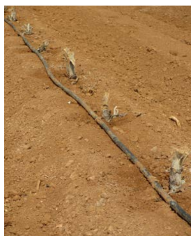
Plantación alcachofa estaca

Algunos de los problemas más comunes en el cultivo de alcachofa multiplicada vegetativamente son las marras de plantación y la falta de uniformidad en el desarrollo del cultivo, como consecuencia de enfermedades, especialmente Rhizoctonia y Verticillium , virosis y plagas como el taladro de la alcachofa. Por esa razón es importante la sanidad y si hay alguna estaca afectada de taladro la desecharemos.