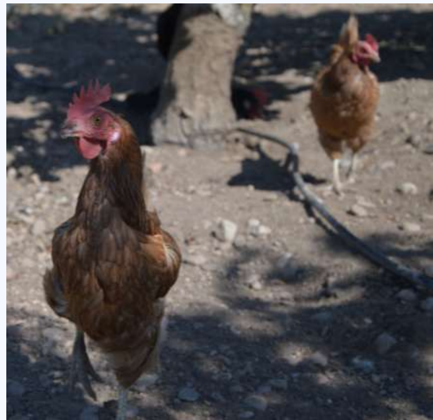
Isa Brown 80