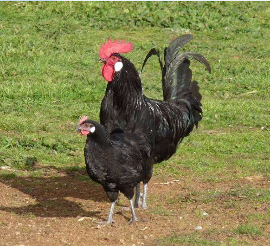
Castellana negra 70