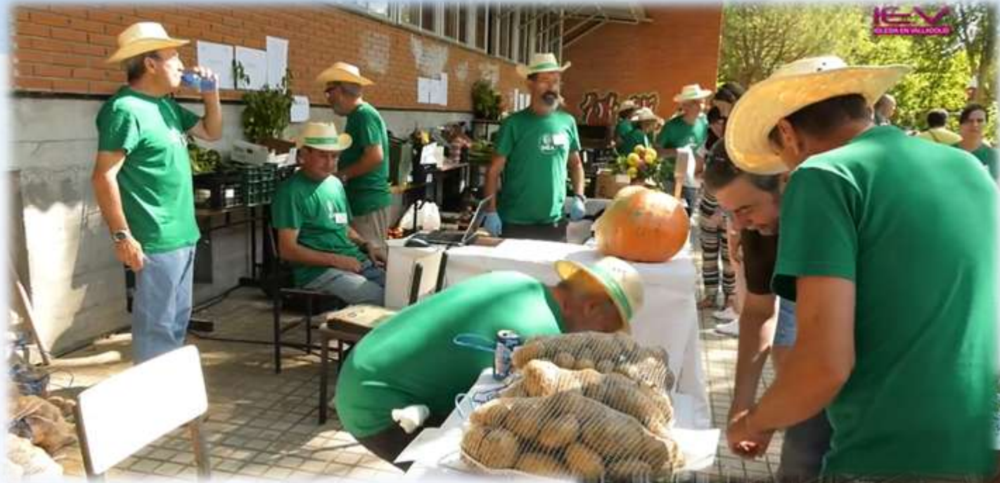
Hortelanos en los puestos de venta para atender al público