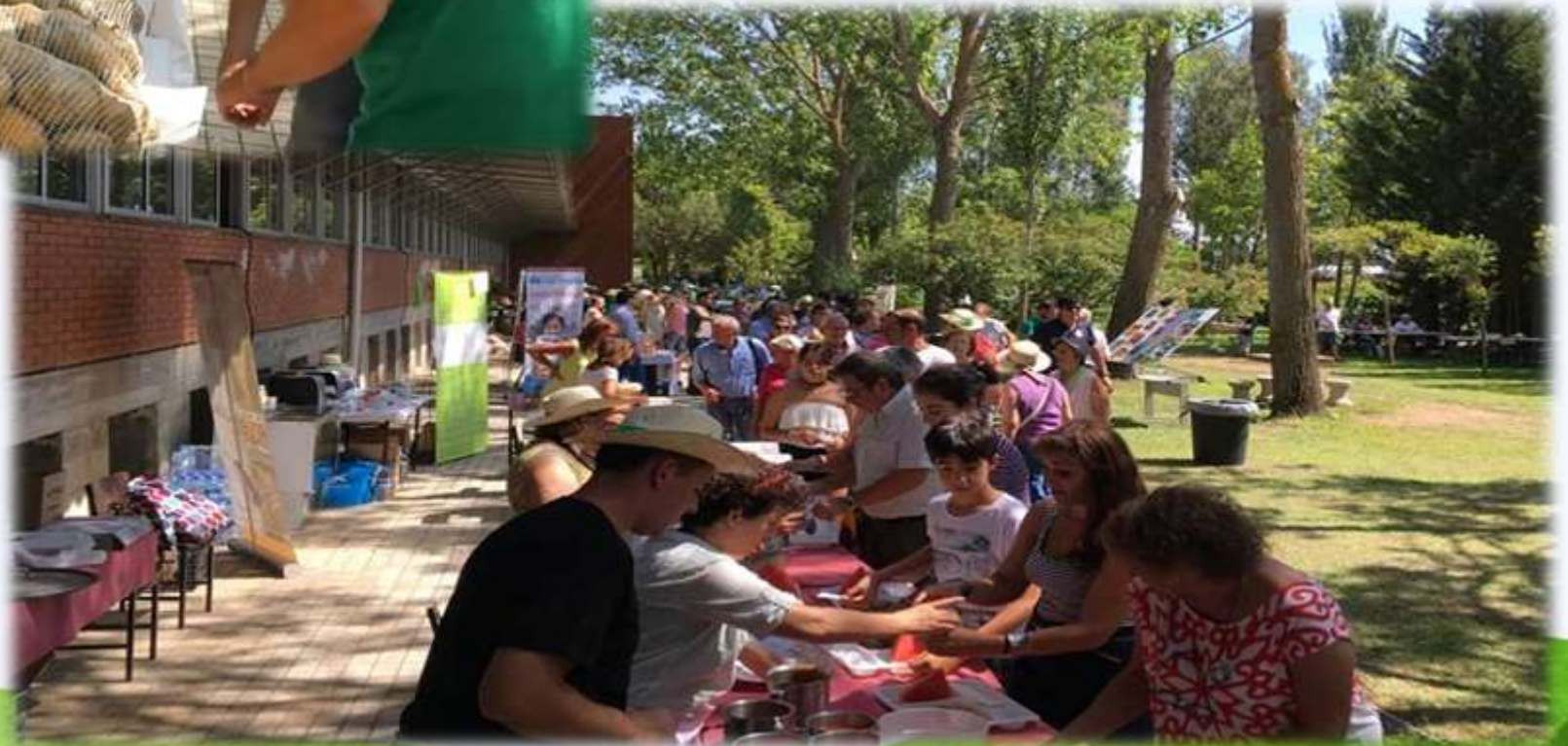
Comida solidaria y ecológica