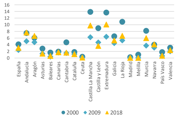
Evolución del peso de las CCAA en el VAB primario nacional