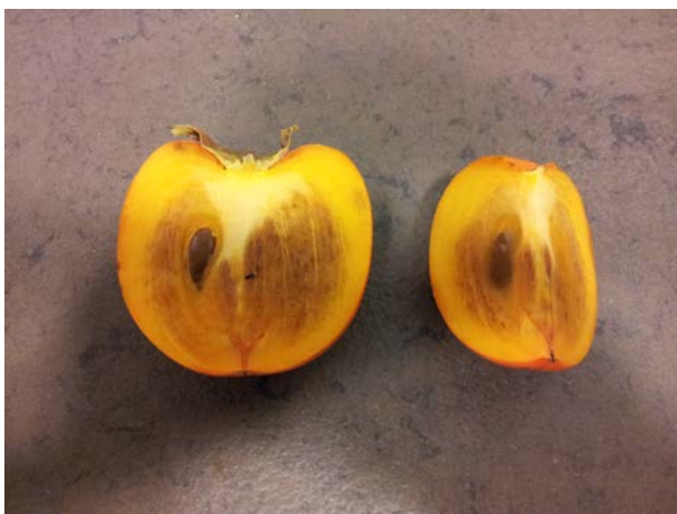
Foto 5.- Fruto de caqui con semillas

En la pasada campaña se tuvo problema de presencia de semillas en alguna parcela, por ello es importante en estos momentos en que los árboles están iniciando la floración, detectar esos árboles aislados que presenten flores masculinas y eliminarlos para evitar la polinización cruzada.