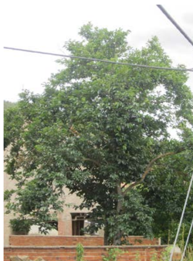
Foto 6.- Árbol de D. virginiana

Existen también numerosas variedades cultivadas en el extranjero que producen flores masculinas y que con su introducción en nuestras zonas de cultivo podrían generar un problema de polinización cruzada con las variedades actualmente cultivadas. Existen también variedades, que aunque teóricamente solamente producen flores femeninas,