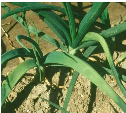
Foto 3.- Primeras lesiones amarillentas