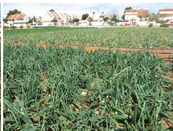
Foto 2. Parcelas con diferentes tratamientos