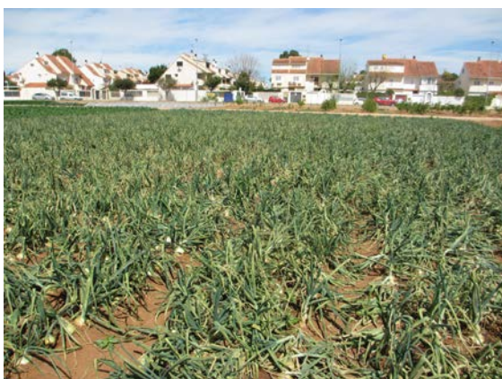
Foto 1.- Parcela afectada de mildiu

El mildiu es una de las enfermedades más importantes en el cultivo de la cebolla. Está causada por el hongo Peronospora destructor (Berk). El hongo se localiza preferentemente en las hojas exteriores, las más viejas. El tejido parasitado pierde el color verde y va pasando a verde claro-amarillento, hasta llegar a un aspecto blanquecino, se debilita, las hojas en esa zona se doblan y la parte superior comenzará a marchitarse terminando completamente seca. Las consecuencias son más graves cuanto más joven sea la planta, ya que la pérdida precoz de superficie foliar afectará al desarrollo final del bulbo.