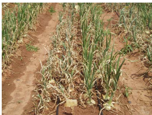
Foto 5. Diferente sensibilidad entre cvs

En diferentes ensayos realizados en el Centro de Experiencias de Cajamar en Paiporta (Valencia), se ha podido constatar que existen diferencias claras de sensibilidad a mildiu entre cultivares.