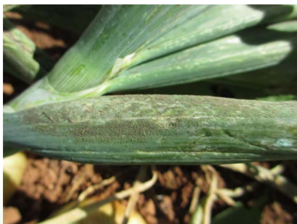
Foto 4. Lesiones pulverulentas