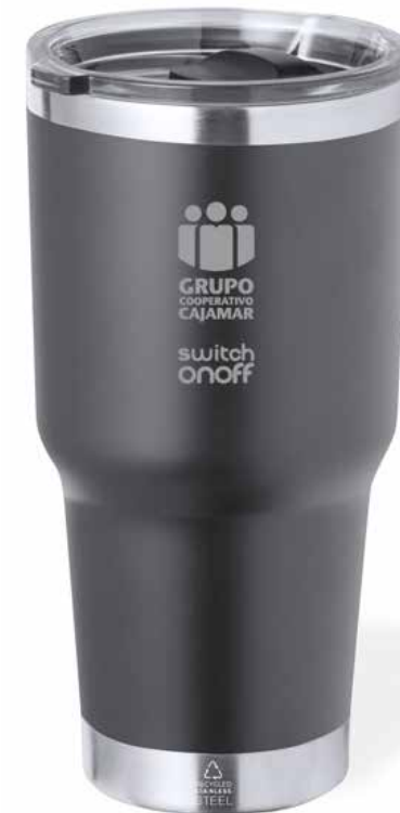
DETALLE PARA LOS INTERVINIENTES